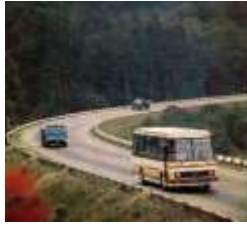
ДОРОГА В ГОРАХ