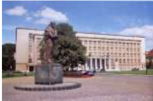
АДМІНБУДИНОК ОБЛАСНОЇ ДЕРЖАВНОЇ АДМІНІСТРАЦІЇ