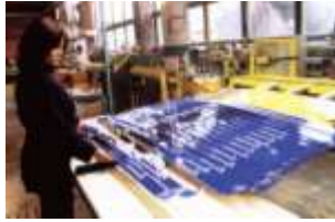
ВИРОБНИЦТВО ФІРМИ "ФІШЕР"