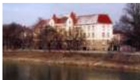
ШКОЛА №1 м.УЖГОРОДА