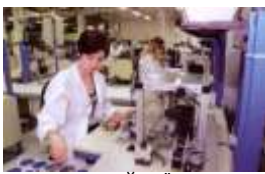
У ЦЕХУ ШВЕЙНОЇ ФАБРИКИ