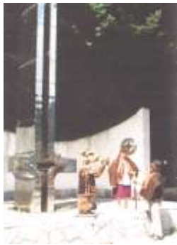
ГЕОДЕЗИЧНИЙ ЦЕНТР ЄВРОПИ

Область розташована на крайньому південному заході України, є географічним центром Європи. Має різноманітний рельєф та кліматичні умови. Її територія з півночі захищена Карпатським хребтом, з північного заходу – Татрами, з півдня – західними Румунськими горами і Мараморошським масивом. Від інших регіонів країни область відділяють Яблонецький, Вишківський, Ужоцький, Верецький та Воловецький перевали висотою над рівнем моря від 931 до 1614 метрів.