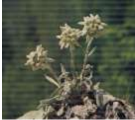
КВІТКА МУЖНОСТІ ЕДЕЛЬВЕЙС