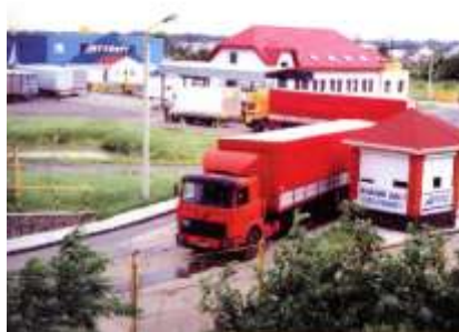
АВТОПОРТ – ЧОП