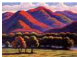
КАРТИНА ЗАКАРПАТСЬКОГО ХУДОЖНИКА В.САБОВА