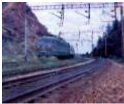
ЗАЛІЗНИЦЯ В ГОРАХ