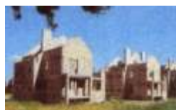
СУЧАСНЕ ЖИТЛОВЕ БУДІВНИЦТВО