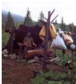
СИРОВАРНИЦТВО НА ПОЛОНІНІ