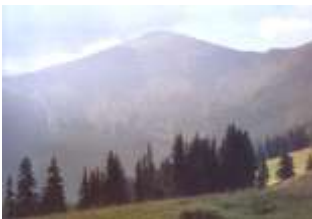
НАЙВИЩА ГОРА УКРАЇНИ ГОВЕРЛА

Влітку середня температура становить плюс 21 0 С, взимку – мінус 4 0 С. Вегетаційний період на низовині триває до 230 днів, у передгір'ях – 210–230 днів, у горах – 90–210 днів.