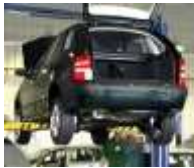
НА КОНВЕЄРІ "СВРОКАРУ"