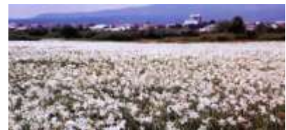
ДОЛИНА ГІРСЬКОГО НАРЦИСУ НА ХУСТЩИНІ