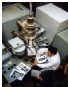
У ЛАБОРАТОРИЯХ УжНУ