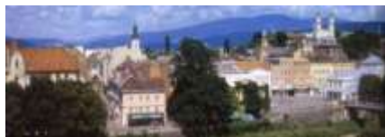
ВИД ОБЛАСНОГО ЦЕНТРУ м.УЖГОРОД