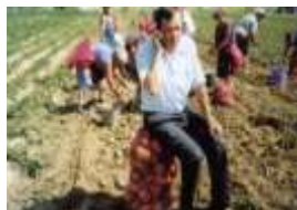
ПРИВАТНЕ ФЕРМЕРСЬКЕ ГОСПОДАРСТВО "КОНИК"