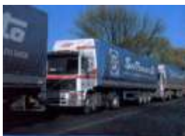
НА ДОРОГАХ ЗАКАРПАТТЯ