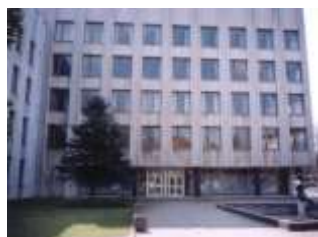
ГОЛОВНЕ УПРАВЛІННЯ СТАТИСТИКИ В ОБЛАСТІ